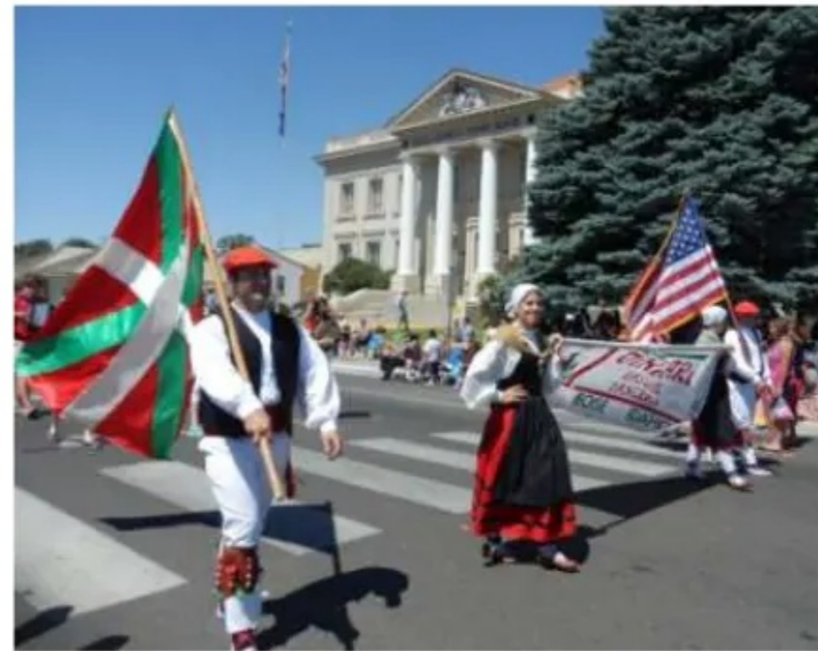
Oinkari Dantza Taldea