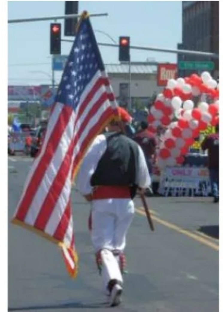
Oinkari Basque Dancers 49 TH National Basque Festival (Elko, 2012)