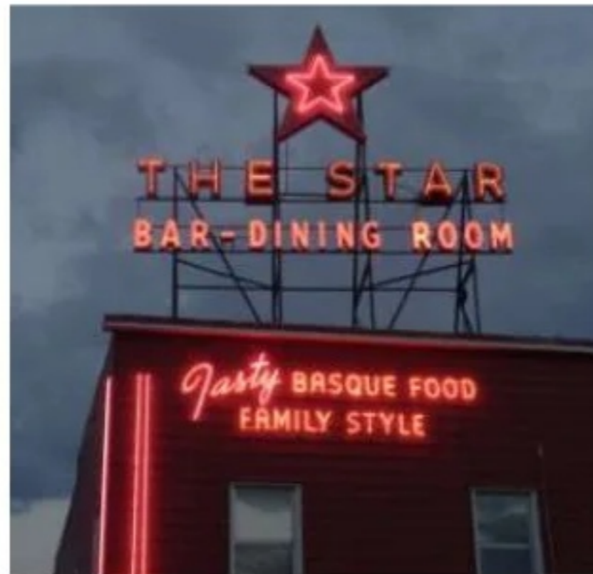
The Star Hotel (Elko, 1910)