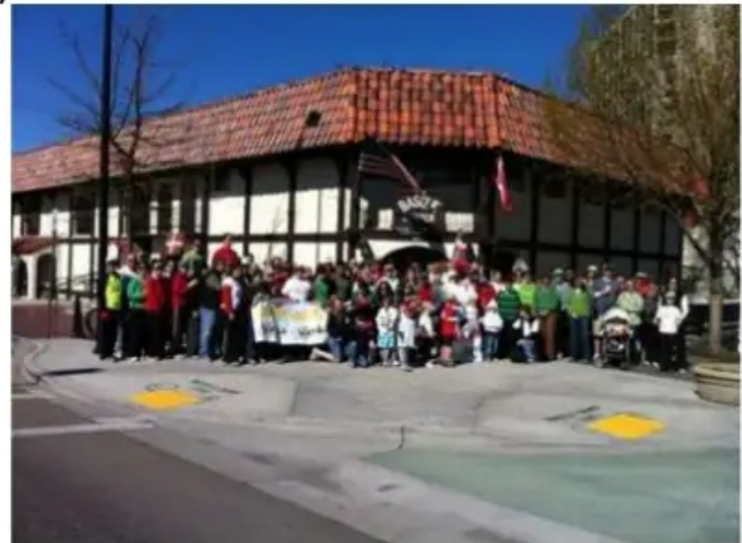
Korrika 17 (2011 urtea)