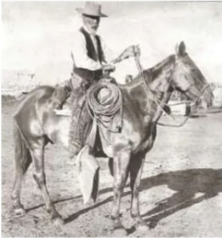
Pedro Altube «Palo Alto» (Elko, 1871)