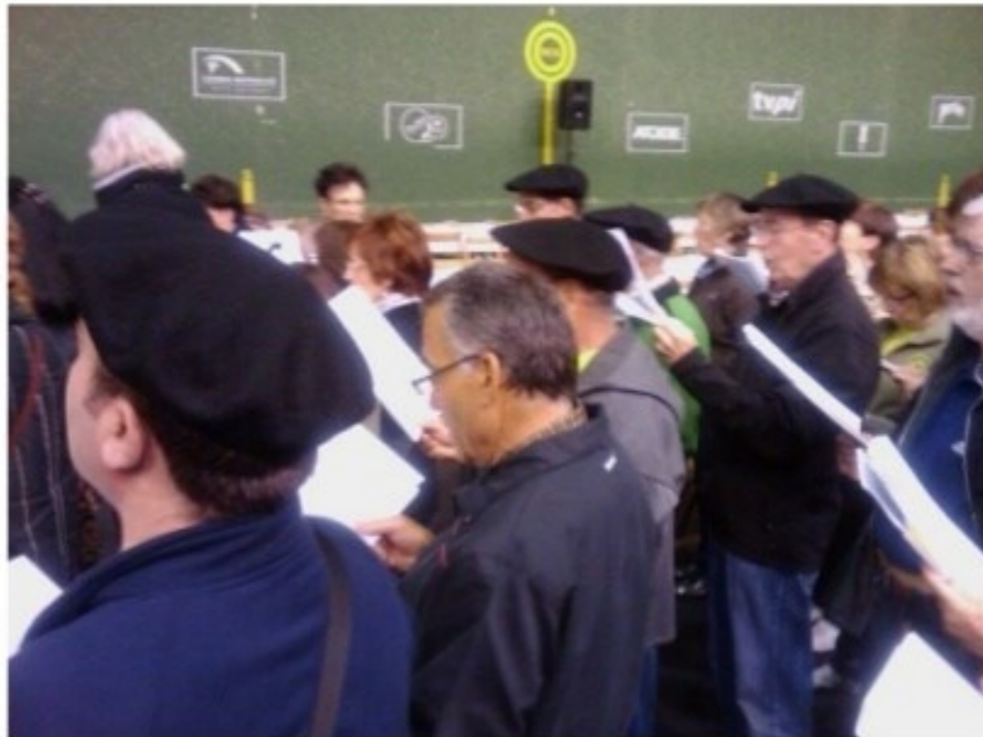
Donibane Lohitzune 2011

50. urteurrenarekin batera beterano talde bat Laguntasunara itzuli zenetik, gero eta ohikoago bihurtu zen emanaldi eta ospakizunak betiko abestiak kantatuz bukatzea.